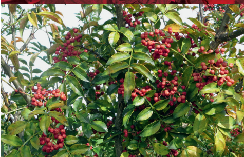
2 LIU Szechuan Pfeffer