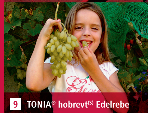
9 TONIA ® hobrevt (S) Edelrebe