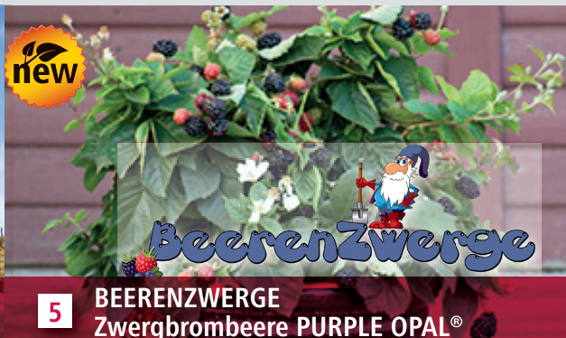
5 BEERENZWERGE Zwergbrombeere PURPLE OPAL ®