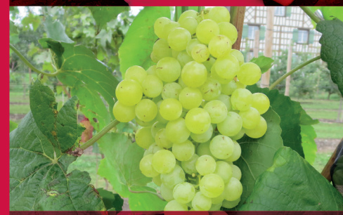
10 ROBUSTAREBE ® HIMROD