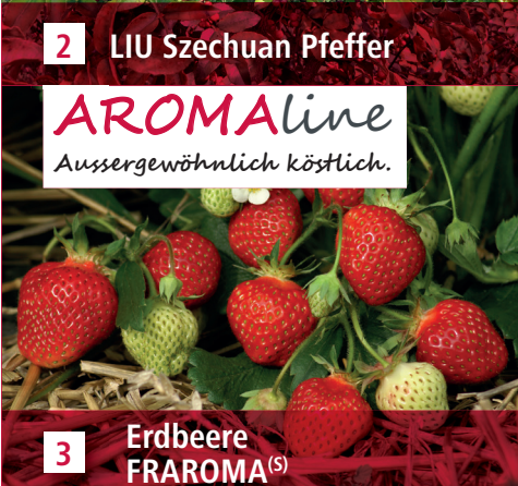
AROMAline Aussergewöhnlich köstlich.