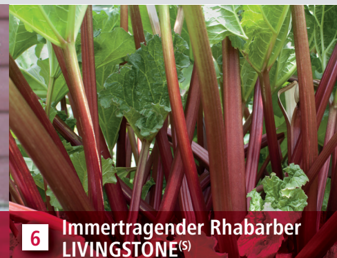
6 Immertragender Rhabarber LIVINGSTONE (S)