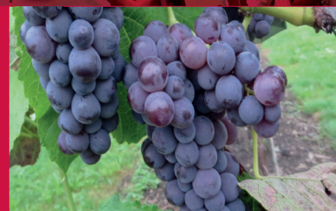
7 ROBUSTAREBE ® SWEETY ®

Die weisse, kernlose Traube mit dem besonderen Geschmack! Lockere Trauben mit feinschaligen, mittelgrossen, weissen gelben Beeren. Würzig, feines Himbeeraroma. Zum Trocknen für Weinbeeren. Sehr frühe Reife ab Anfang September.