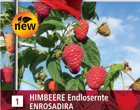
1 HIMBEERE Endlosernte ENROSADIRA

Besuchen Sie unsere Website www.haerberli-beeren.ch , mit vielen Tipps und umfangreichen Sortenbeschreibungen.