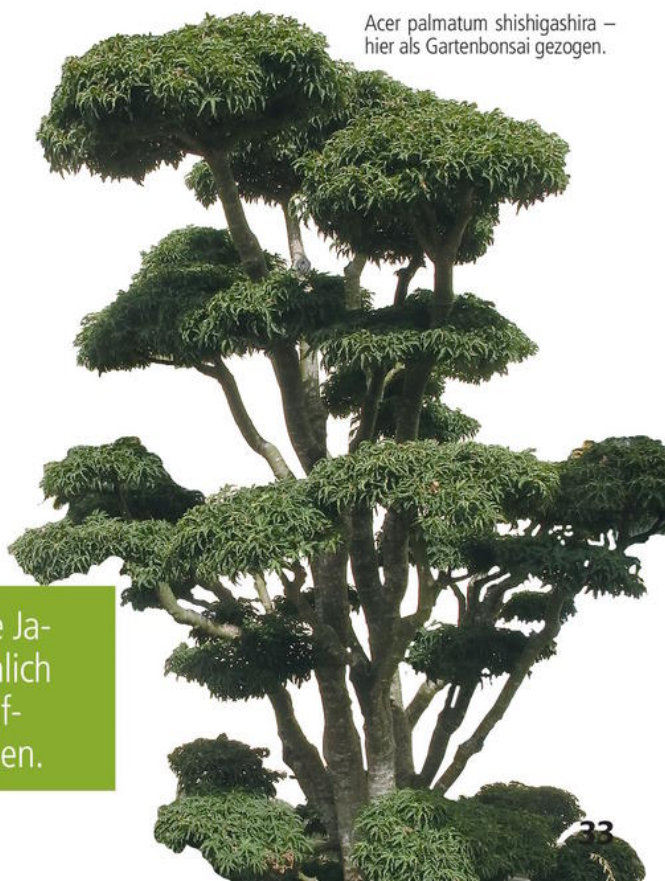
Acer palmatum shishigashira – hier als Gartenbonsai gezogen.

TIPP Ahorne lieben einen durchlässigen Boden, vor allem die Japanischen Ahorne, daher diese seltener, aber dann reichlich wässern. Der Boden sollte einen pH-Wert von sieben aufweisen. Deshalb alle zwei bis drei Jahre Algenkalk streuen.