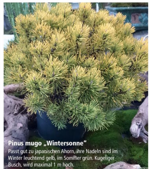
Pinus mugo „Wintersonne“

Passt gut zu japanischen Ahorn, ihre Nadeln sind im Winter leuchtend gelb, im Sommer grün. Kugeliger Busch, wird maximal 1 m hoch.