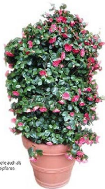
Kamelie auch als Kübelpflanze.