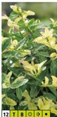
12 T B