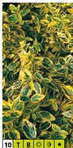
10 T B

Kriechende oder kletternde immergrüne Pflanze mit kleinen, silberrandigen Blättern. Auch als Bodendecker geeignet. Höhe bis 50 cm, Länge bis 2 m.