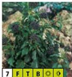
7 F T B