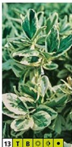
13 T B