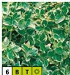
6 B T