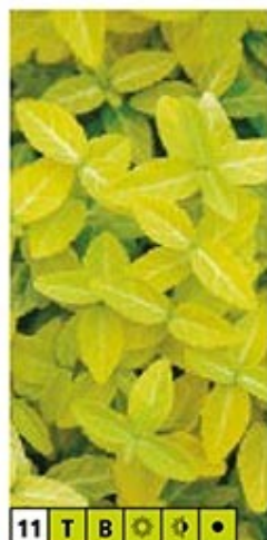
11 T B