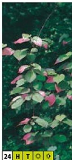
24 H T ☀️ 🌿