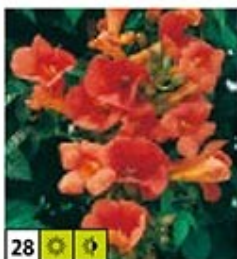
28 ☀️ 🌿