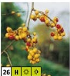
26 H ☀️ 🌿