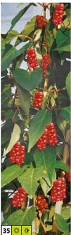
35 ☀️ 🌿