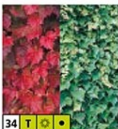
34 T ☀️ 🌿