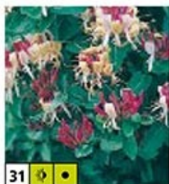
31 🌿 🌿