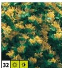
32 ☀️ 🌿