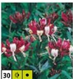
30 🌿 🌿