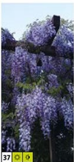
37 ☀️ 🌿

24 Actinidia kolomikta – Buntlaubige Zierkiwi Laub interessant rosa gestreift, sehr robust! Kletternd, Höhe 2,5–4,5 m.