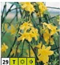
29 T ☀️ 🌿