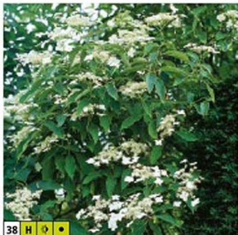
38 H 🌿 🌿