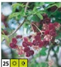
25 ☀️ 🌿