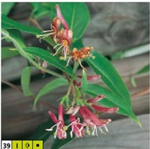
39 I 🌿 🌿