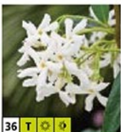
36 T ☀️ 🌿