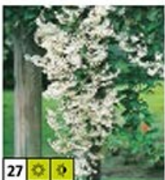
27 ☀️ 🌿