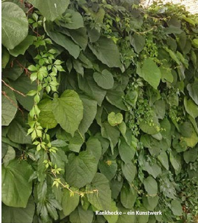
Rankhecke – ein Kunstwerk

1 Carpinus betulus – Hainbuche Einheimisch, sehr schnittverträglich, hält im Winter lange das trockene Laub, daher guter Sichtschutz.